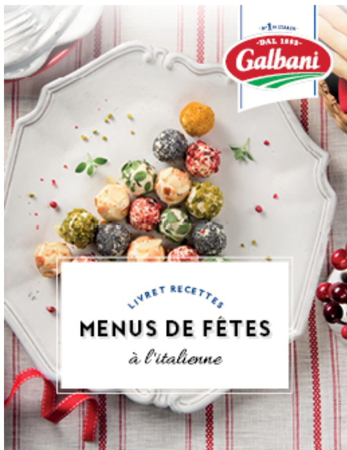
Menus de fêtes à l'italienne